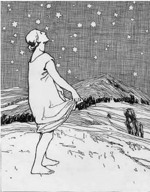
(Otto Ubbelohde, Sterntaler)